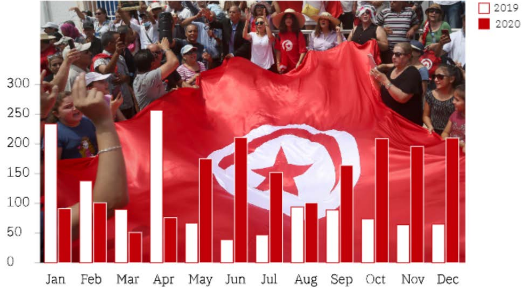
Figure 1. Tunisia: Total Number of Protests, 2019 vs. 2020