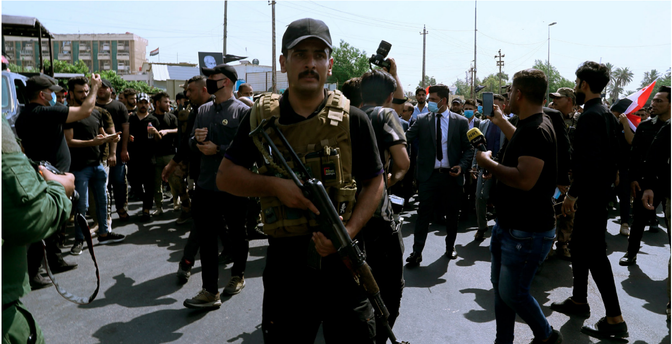
رژه جنگجویان شبه‌نظامی طرفدار ایران در مرکز بغداد، عراق، ۲۹ ژوئن ۲۰۲۱

ترتیب نشان‌دهنده تبدیل آشکار این حملات به کارزاری با تلفات نامعلوم ۵ اما در هر حال دردناک و فرسایشی، علیه حضور آمریکا در عراق است. ۶ پس از چهار ماه حملات پهپادی، ۹ نویسندگان این مقاله دریافتند